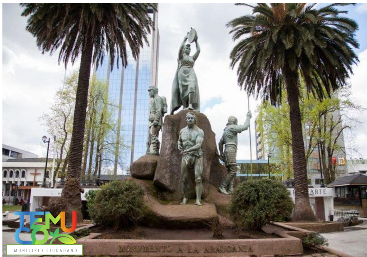
Imagen 1: Plaza Aníbal Pinto