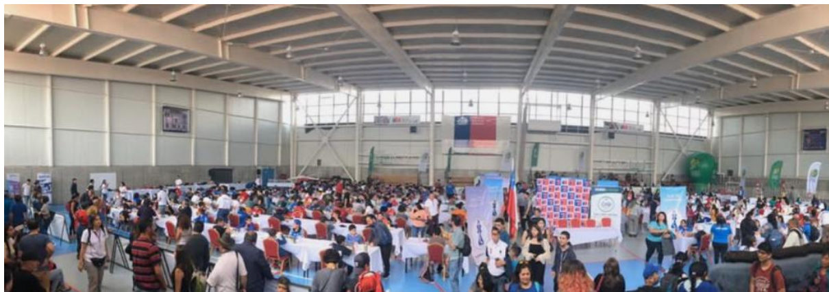
Imágenes 2: Vista Ciudad de Temuco y Recinto Deportivo